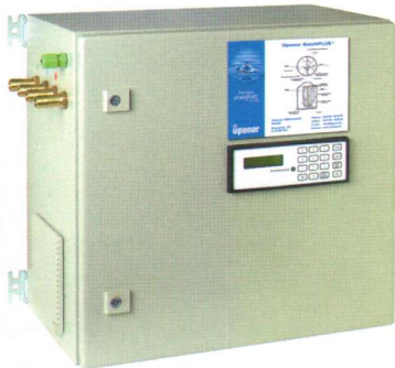
Der steckerfertige Uponor-Schaltschrank zur Wandmontage betreibt die Kläranlage vollautomatisch.

Das SBR-Verfahren bietet die Möglichkeit, durch unterschiedliche Voreinstellungen auch die weitergehende Abwasserreinigung bis hin zu Nitrifikation und Denitrifikation zu erreichen. In Urlaubszeiten wechselt die Anlage automatisch in einen stromsparenden Betrieb. Wie bei der bewährten Kleinkläranlage Uponor 3K PLUS® befinden sich auch bei der BatchPLUS® weder elektrische Aggregate noch bewegliche Verschleißteile in der Kläranlage.