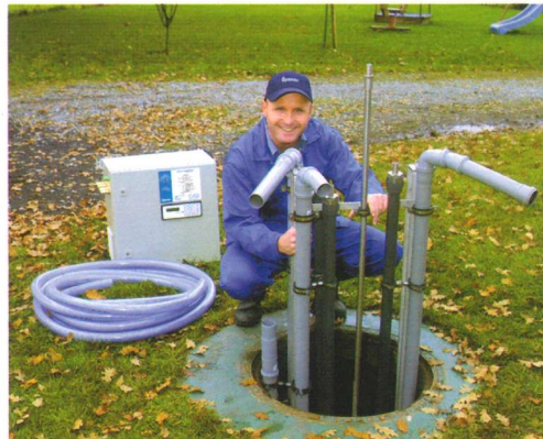
Der einfache Einbau in jeden Behälter ohne elektrische oder bewegliche Teile im Abwasser zeichnet Uponor BatchPLUS® aus.

Alle wartungsbedürftigen Teile befinden sich zusammen mit der elektronischen Steuerung in einem Schaltschrank. Dieser entspricht allen geltenden Normen und ist CE-zertifiziert.